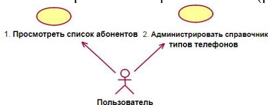
Рисунок 1 – Варианты использования телефонной книги

Задача 1. Разработать диаграммы вариантов использования для описания функциональности локальной электронной телефонной книги (рисунок 1).