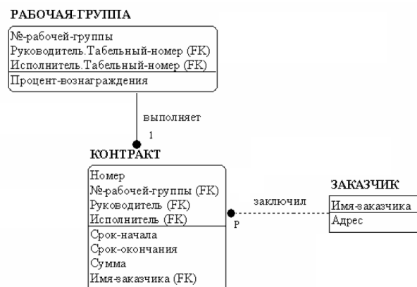
Рисунок 1. – ?

Задача 7. Как формализуются на диаграммах IDEF1X связи 1:1? 1:M? M:N?