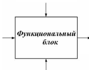
Рисунок 1. – ?

Задача 5. В соответствии с правилами интерпретации модели IDEF0, на рисунке 1 представлена её начальная диаграмма в общем виде. Как она называется? Что соответствует (в общем виде) стрелкам указанным на диаграмме рисунка 1?