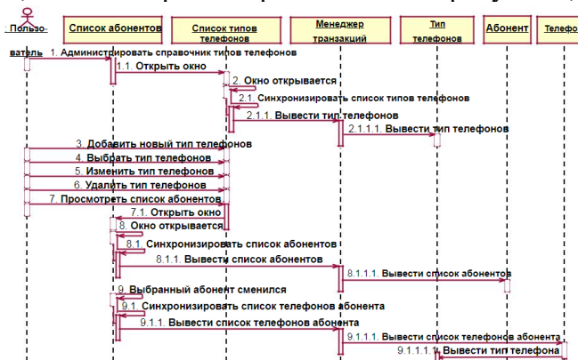
Рисунок 1 – Диаграмма _____

Задача 2. Определите, какая диаграмма представлена на рисунке 1, поясните её.